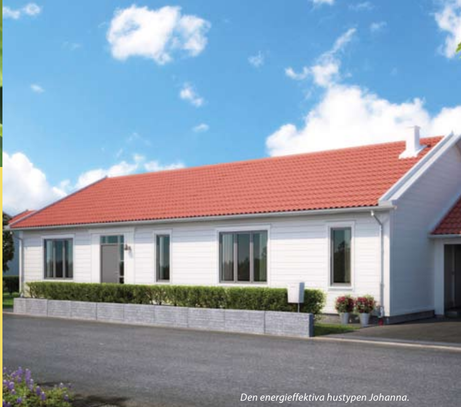
Den energieffektiva hustypen Johanna.

Bostäder står för cirka 40 procent av energiförbrukningen i Sverige. På senare tid har medvetenheten om boendets betydelse för klimatet ökat. När du köper en bostad från Kärnhem kan du vara säker på att du får ett hus som både din elmätare och klimatet har glädje av.